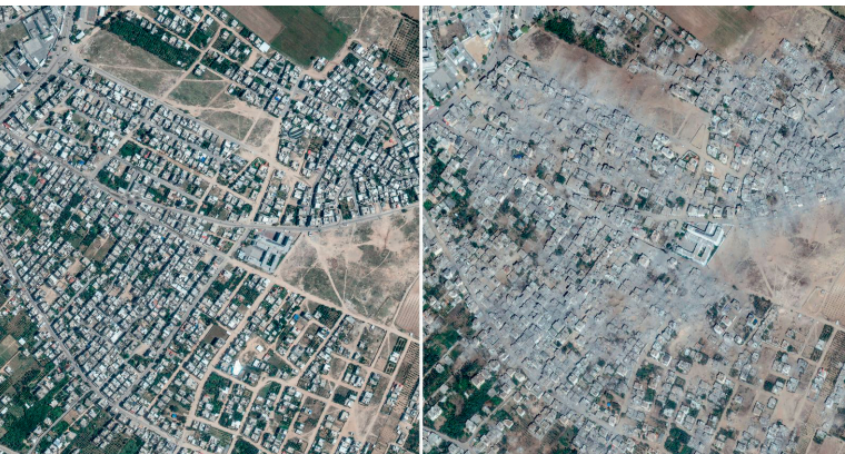
Abbildung 1: Beit Hanoun im Gazastreifen vor (01.05.2023) und nach (23.10.2023) flächendeckenden israelischen Bombardements.

Hier sei nur eine kurze Zusammenfassung der wichtigsten historischen Fakten gegeben und auf weitere Referenzen verwiesen, um sich ein besseres Bild der Situation machen zu können.