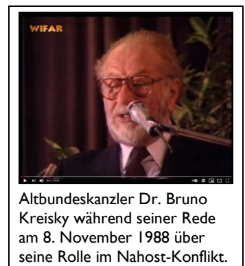
Altbundeskanzler Dr. Bruno Kreisky während seiner Rede am 8. November 1988 über seine Rolle im Nahost-Konflikt.

Sonntag, also vor einer Woche, in London, ich war an dem Telefon – Arafat: Ich weiß, dass man jetzt, wenn man nur will, eine Lösung finden kann, nur [hebt laut die Stimme und ruft in das Publikum] muss man